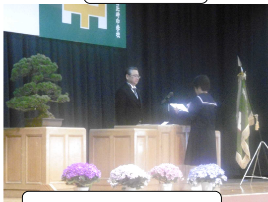
新入生誓いのことば