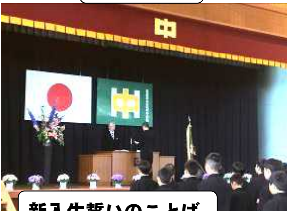
新入生誓いのことば