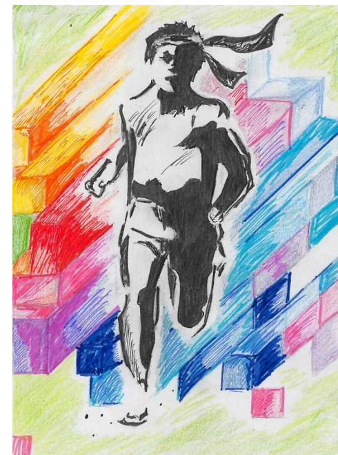
【優秀賞】 神重 如春 (3年)