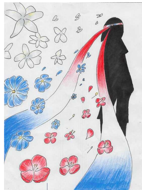
【優秀賞】 石井 ゆずゆ (3年)