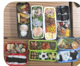
(生徒自作のお弁当)