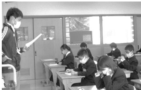
2年B組 学級経営目標