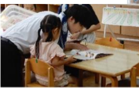
因島南認定こども園