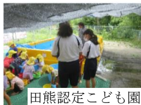
田熊認定こども園