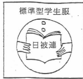
日被連標準マーク