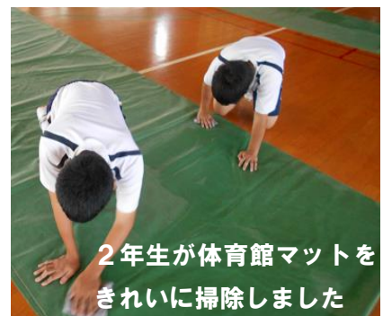
2年生が体育館マットを きれいに掃除しました

また、今までお世話になった旧体育館への感謝の気持ちを表すため、9月15日に、生徒会主催の「旧体育館お別れ球技大会」を開催する予定です。