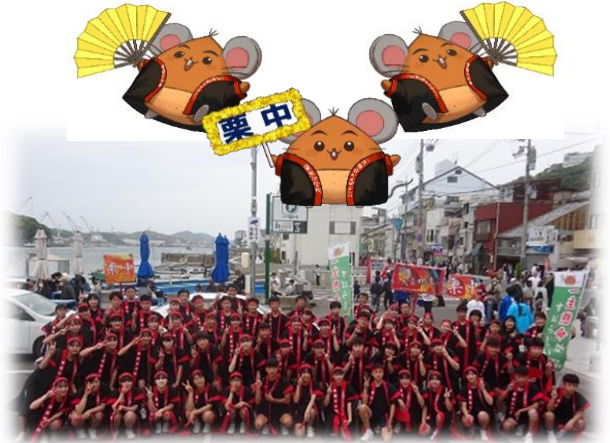
令和5年度「審査員特別賞」受賞

今年は、3年生全体で臨み、もちろんグランプリを目指しています。短い練習時間の中で、リーダーを中心に練習に励んでいます。ぜひとも多くのご声援をお願いします。