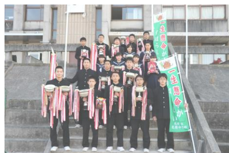
今年の優勝カップ