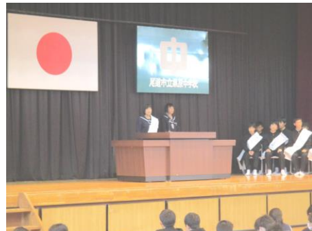
立会演説会の様子