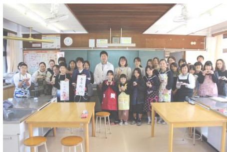
和菓子づくり（研修委員会）