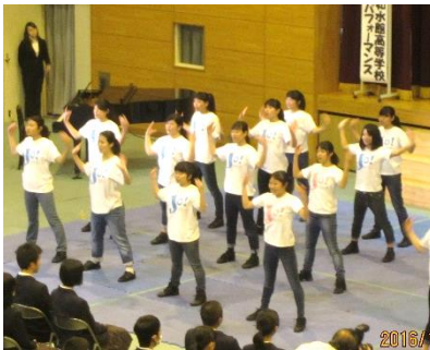
如水館高等学校によるパフォーマンス

育友会の各部を中心にバザー(学年教育部)、育友会合唱(体育部)で大変お世話になりました。本当にありがとうございました。