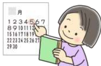
かりたほんは 返さやく日までに返そう