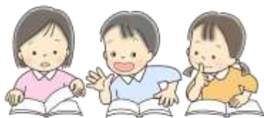
としよしつ しず 図書室では静かにしよう