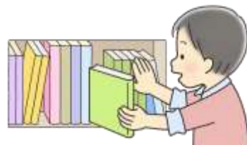
でしたほんは 元の場所にもどそう