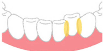
は は かさ 歯と歯が重なったところ