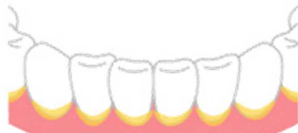
は は さかいめ 歯と歯ぐきの境目