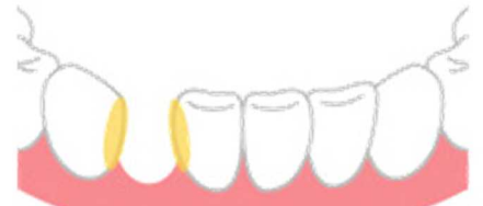
ぬ は 抜けた歯のまわり