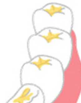
おくば か あ 奥歯の噛み合わせ