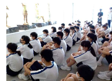
みんな熱心に話を聞いて、時間いっぱいデッサンに取り組みました。