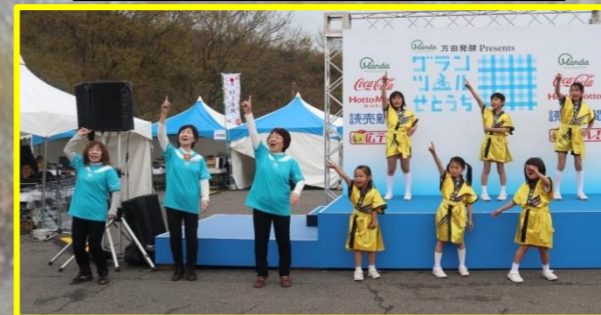
にこびんしゃん祭り（よもそろダンス）