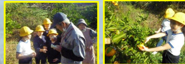
総合的な学習（3年）「わくわくみかん隊」