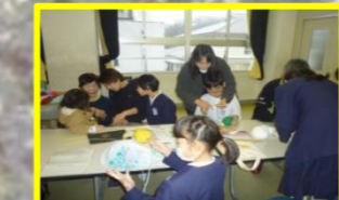
ふれあい参観日（日曜参観日）