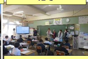
薬物乱用防止教室