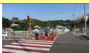
地域・保護者の方による 朝のあいさつ運動