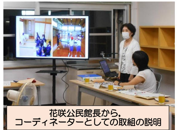
花咲公民館長から、 コーディネーターとしての取組の説明

小中学校からは、小中合同研修会、作業部会の取組の様子や学校評価中間結果報告を行い、花咲公民館長からコーディネーターとしての取組を説明していただき、委員の皆様からご意見をいただきました。