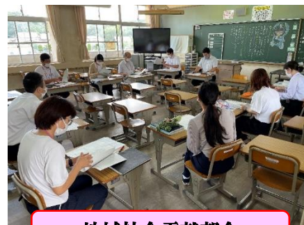
地域社会貢献部会