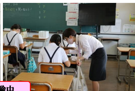
向東中学校の先生による模擬授業を体験中