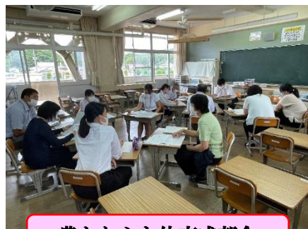
豊かな心と体育成部会