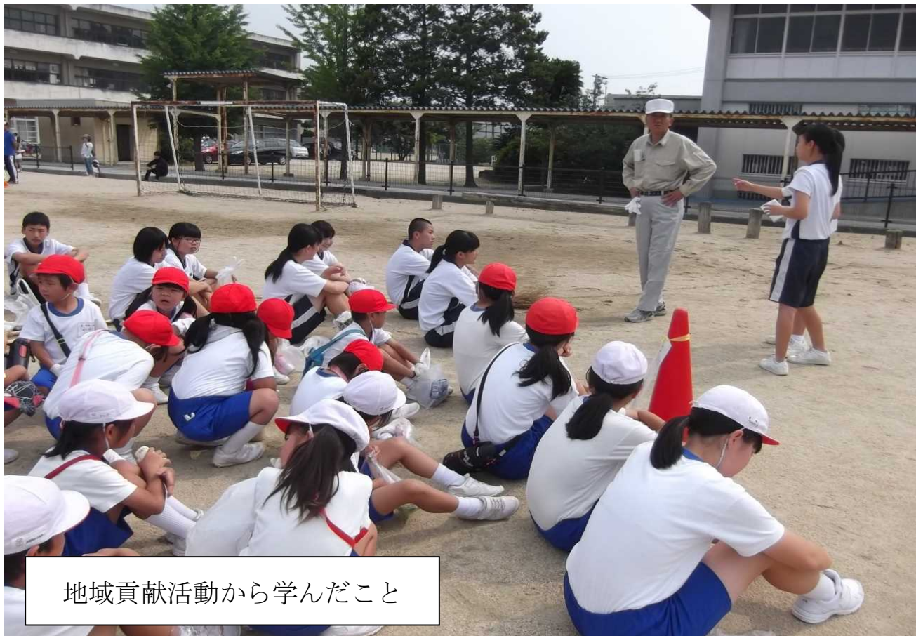
地域貢献活動から学んだこと