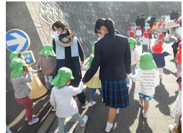
園児の避難をサポート