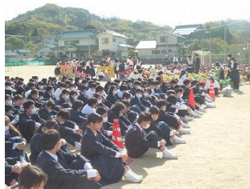
小学校グラウンドに全員集合!