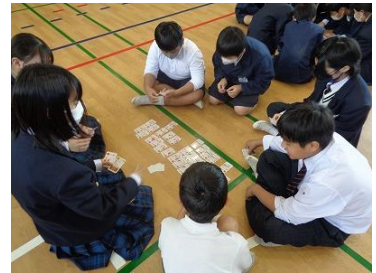
理解と交流を深めるカードゲーム