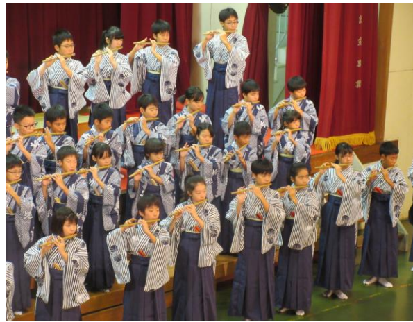
長江小学校の沿革