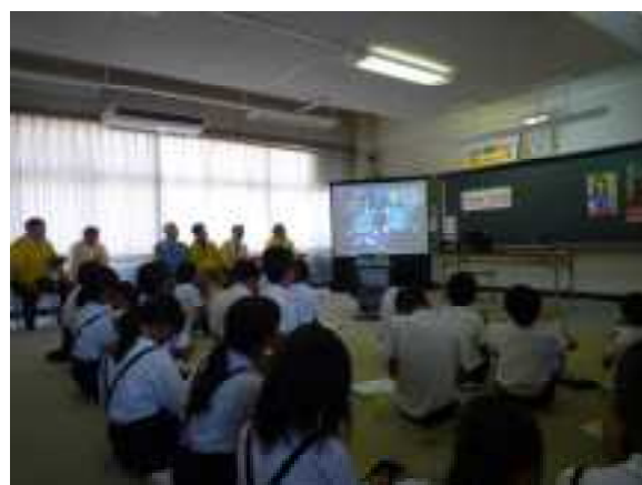
薬物は脳を破壊することを知り驚きました