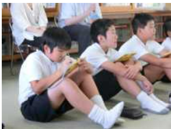
しっかりメモを取りながら聞きました