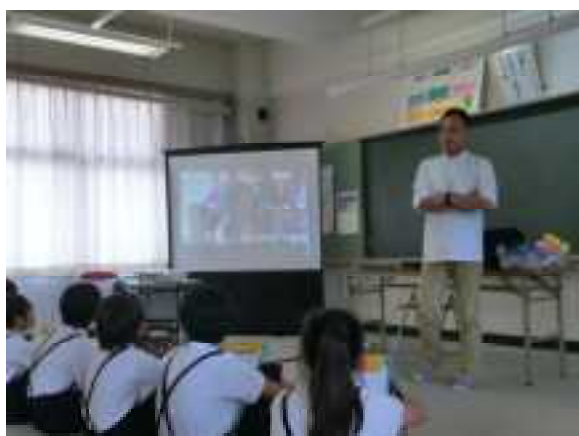
講師の先生から詳しくお話を聞きました