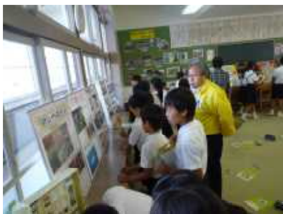
写真パネルから原料について学習しました