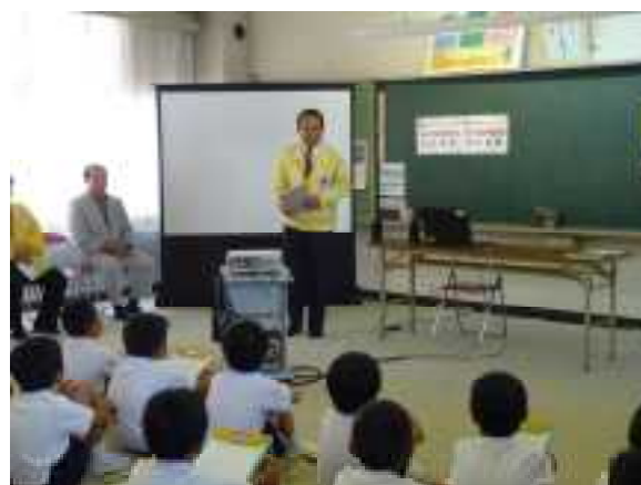
5年生も静かに話を聞きました