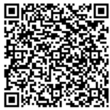
(登録用 QR コード)