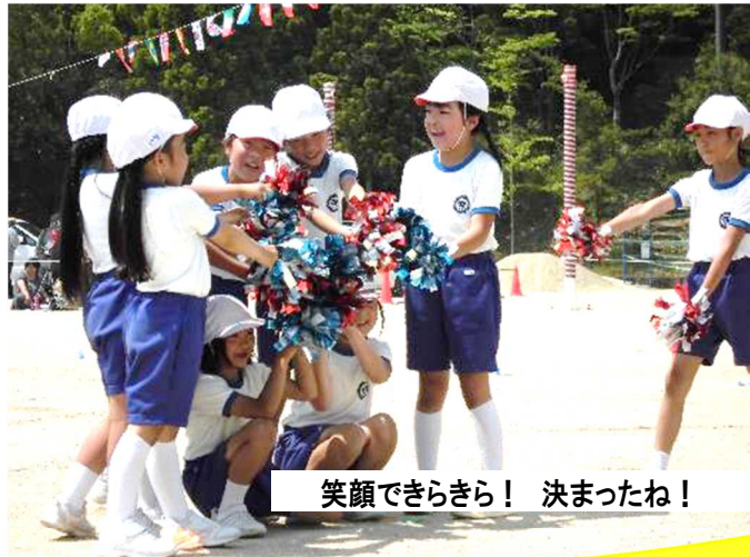
笑顔できらきら！ 決まったね！