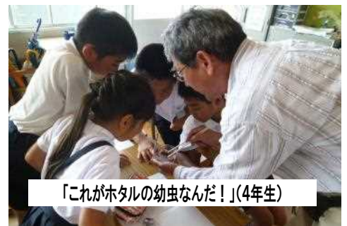
「これがホタルの幼虫なんだ！」(4年生)

5/24に、4年生が公衆衛生協議会の皆様のご指導で藤井川の水生生物観察会に参加しました。また、5/31には「藤井川を守る会」の國本会長様にお出で頂き、「藤井川のタベ」についてお話をうかがいました。また、同じ日には1・2年生も親水公園へ川探検に出かけました。地域の皆様の支えの中、地域を通して学ぶ取組を、今後も大切にしていきたいと思っております。