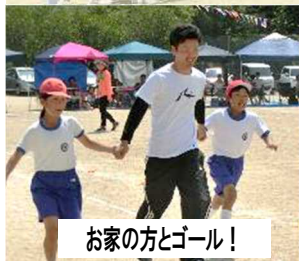
お家の方とゴール！