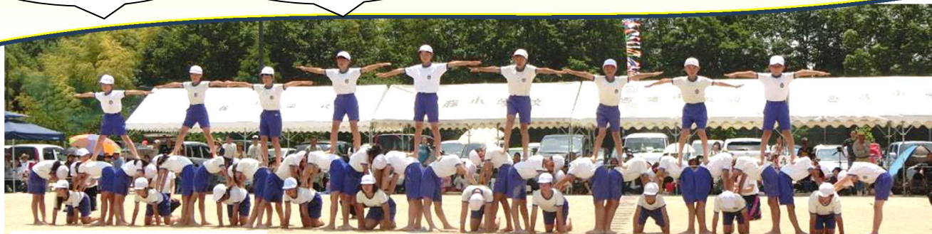
力を合わせて完成。Perfect！

5月22日、日差しあふれる好天のもと、本年度の運動会を行うことができました。児童は練習の成果をお家の方、地域の方にご覧頂こうと、元気に、そして自分の役割を考えながら演技・競技に臨みました。来賓の方々からも「この暑い中、子供達は本当に頑張っていて素晴らしい」「子供がきらきら輝いて見えます」「学校としての統一感が見えました」等々、たくさんのお言葉を頂きました。保護者の皆様からもアンケート等で「子供の姿にすごく成長を感じました」「時間があっという間に過ぎました」「保護者の方のマナーも良く、気持ちよく応援できました」「低学年の子がテントで待機している時も上の学年がきちんとお世話をしていました」等々のご感想を頂きました。児童のがんばりや成長、また、演技以外の様々な良い姿を見つけてくださっていることを、そして何より運動会を「ともにつくる」という皆様の思い（子どもたちとの綱引きにもたくさんご参加くださり、ありがとうございました。）を感じることができました。ご協力、ご声援に改めて感謝申し上げます。この学びを力に子供たちが一層伸びていけるよう、また、ご評価、ご助言を今後活かせるよう、教育内容・教育環境の充実に引き続き取り組んで参ります。ありがとうございました。