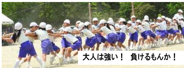
大人は強い！ 負けるもんか！

尾道市立西藤小学校 尾道市西藤町1500番地 TEL・FAX 47-2274 e-mail : nishifuji-e@onomichi.ed.jp