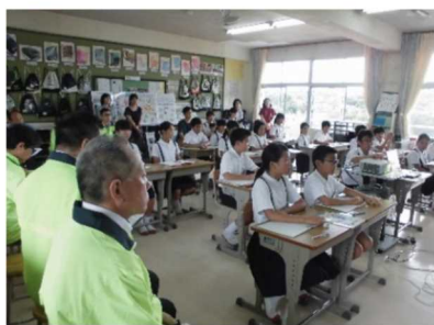
6年生 薬物乱用防止教室で （尾道ライオンズクラブの皆さん）

7月8日（土）土曜授業の1コマより・・・ゲストティーチャーの皆さん 有難うございました。