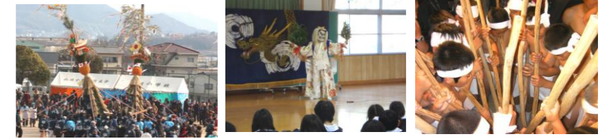
<山波のとんど祭り>