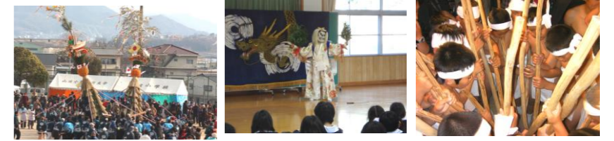
<山波のとんど祭り>