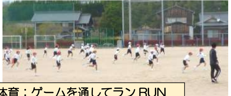
体育：ゲームを通してランRUN