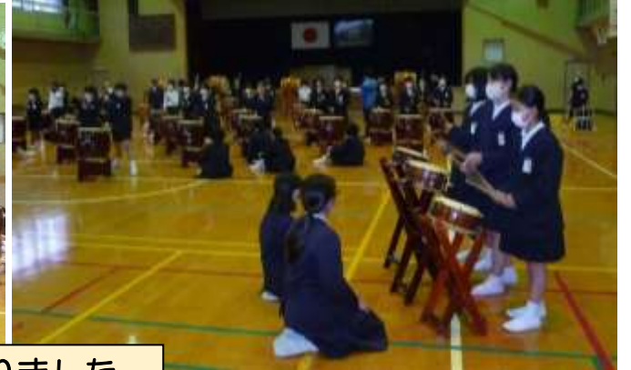
「伝統を受け継ぐ」橘香太鼓も始まりました