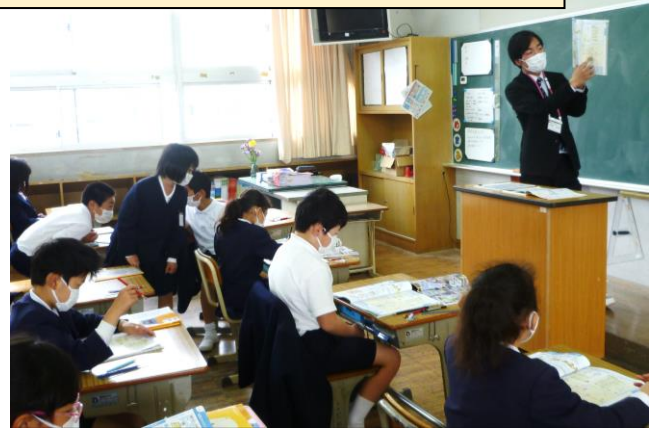
社会科で地図の読み方の学習