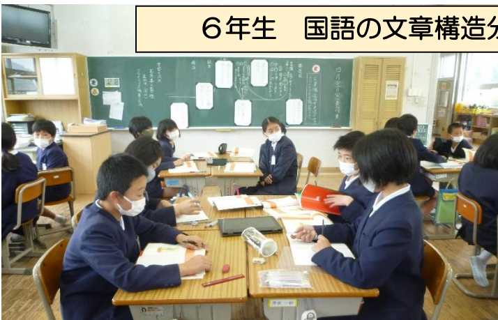
6年生 国語の文章構造分析