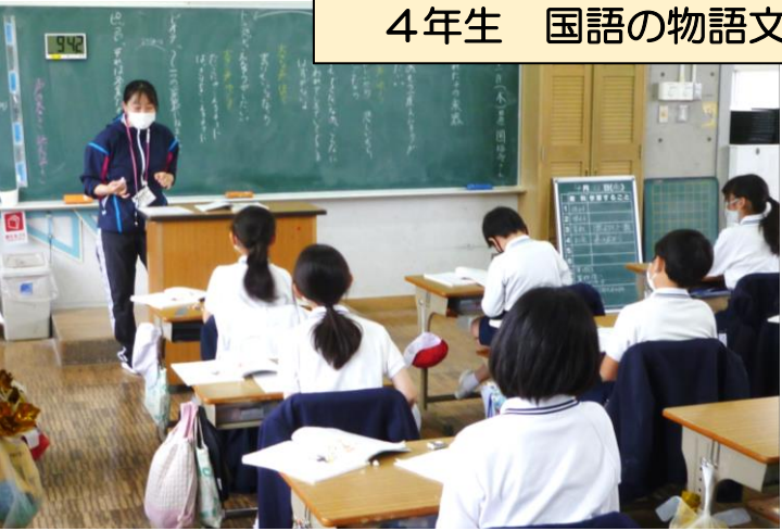
4年生 国語の物語文