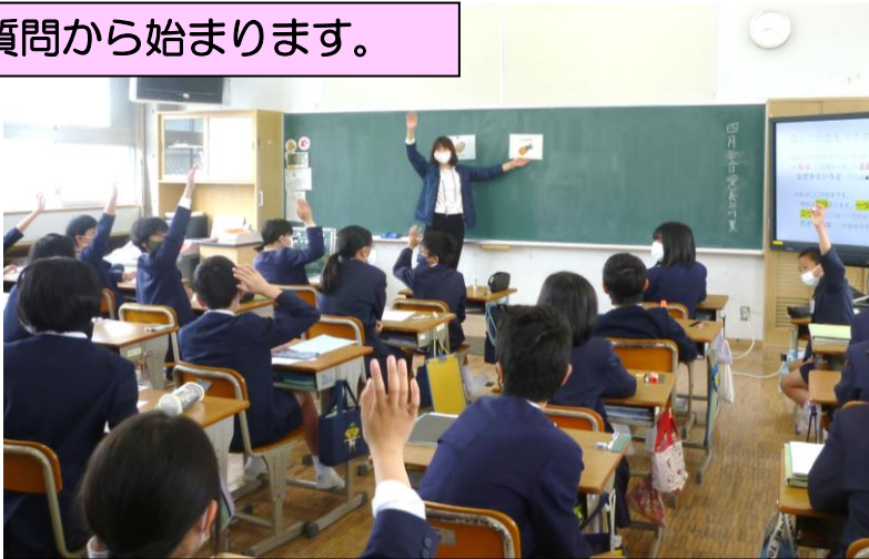
高学年はナンバリングを使って、理由を明確にして考えを伝えます。