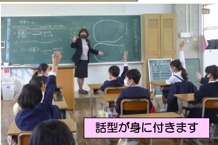
話型が身に付きます