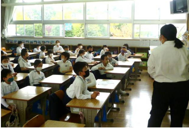
「好きですか、きれいですか」の質問から始まります。