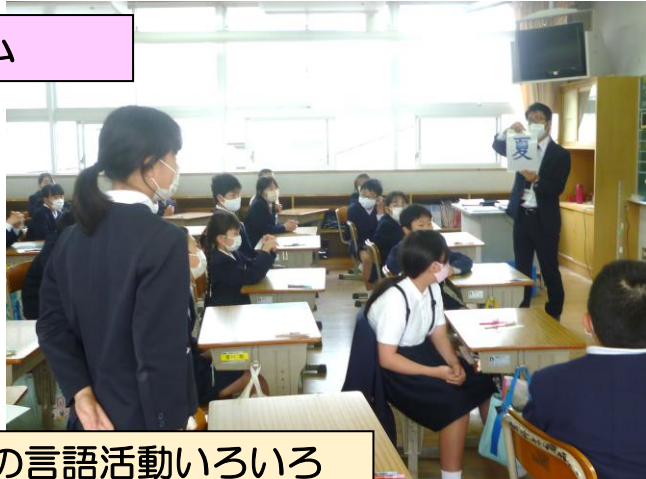
モジュールタイムでの言語活動いろいろ