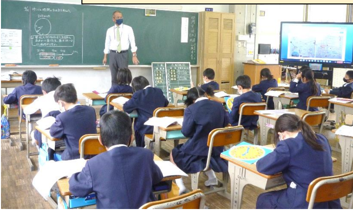
3年生 算数の割り算