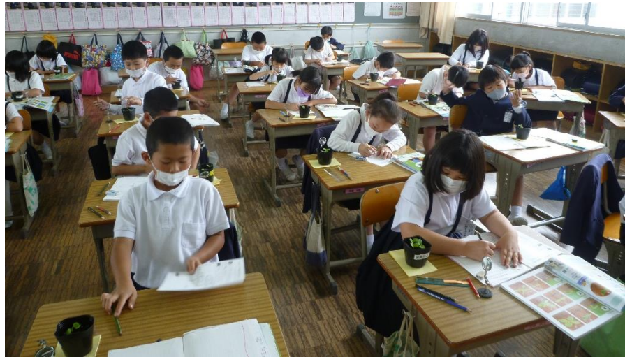
虫めがねを使って、ふた葉の間から出ているものを観察しました。