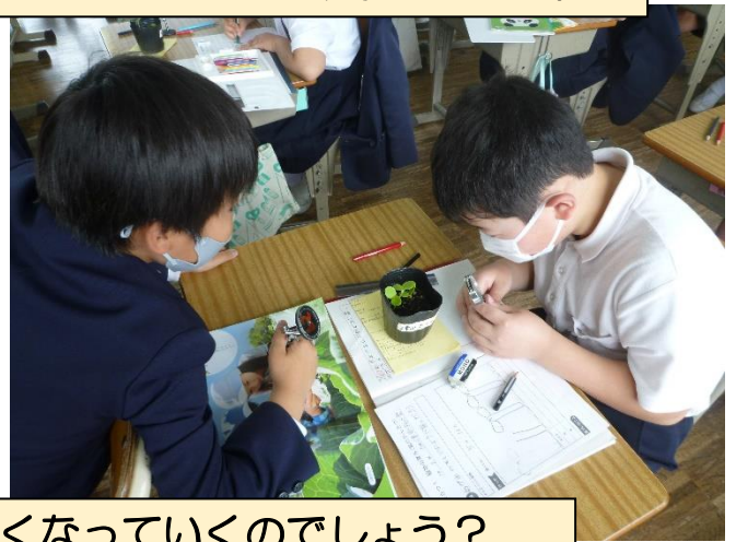
芽が出た後、どのように大きくなっていくのでしょうか？