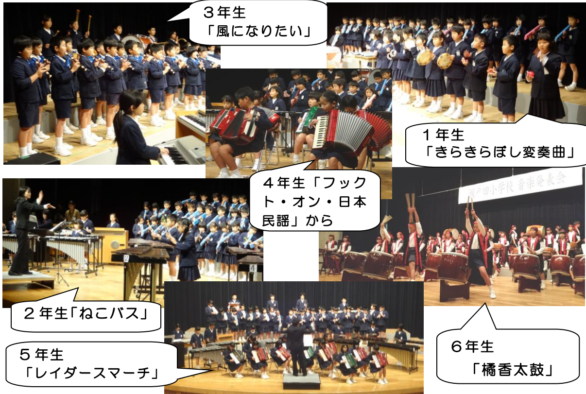
3年生 「風になりたい」

11月21日(土)に音楽発表会を開催しました。どの学年も積み重ねてきた合唱や合奏の練習の成果を発揮することができました。当日は、多くの地域や保護者の皆様にご観覧いただき、子どもたちもいつも以上の発表ができたようです。ご多用な中、ほんとうにありがとうございました。