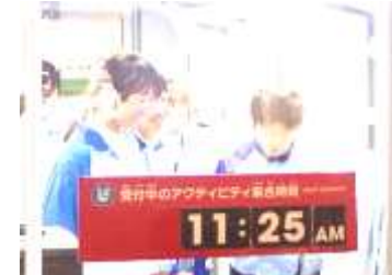
職業体験(キッザニア甲子園)