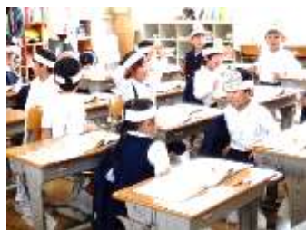
↑ 道徳の授業。「はしのうえのおおかみ」(1年生)

今後も高見小学校の教育活動・PTA活動に一層のご理解とご協力を、どうぞよろしくお願いいたします。