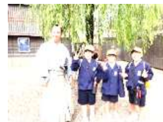
武士の方と♡(東映太秦映画村)

校外での行動の安全やマナーをしっかりと心得て行動した6年生。たくさんの学びを持ち帰ることができました。ご協力くださいました保護者の皆様、ご支援くださいました諸施設等関係の皆様、ありがとうございました。