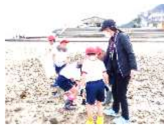
↑ 干潟を歩いてごみや漂着物を回収しました。