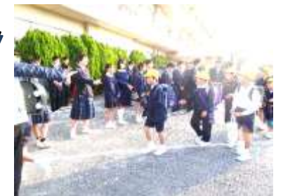
1号棟の前から児童玄関まで 挨拶してくれました

11月18日(火)に令和7年度の高見小学校授業公開を行いました。授業公開には、尾道市教育委員会の皆様や学校関係者評価委員・評議員の皆様、向島中学校・向島中央小学校・三幸小学校の先生方にお越しいただき、1年・たんぼぼ1組の算数科、5年の理科を参観いただきました。子供たちが楽しくしっかりと学べるよう今後も取り組んでいきます。