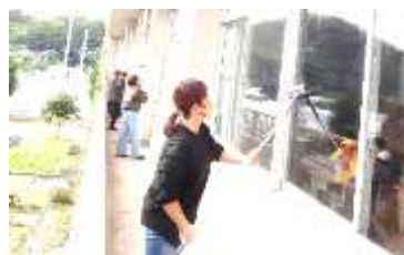
↑ 窓がとてもきれいになりました。