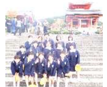
みんなで一緒に。(清水寺)