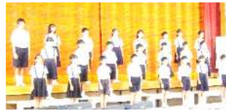
5・6年生による合唱。きれいな歌声でした