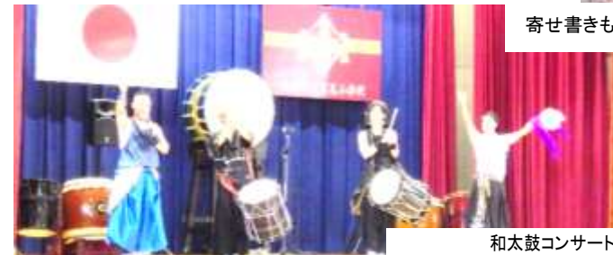
和太鼓コンサート 大盛り上がりでした。