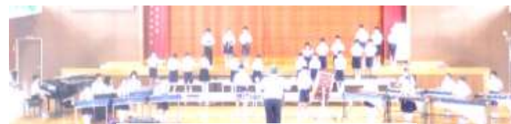
3・4年生による合奏。心を合わせて演奏しました。