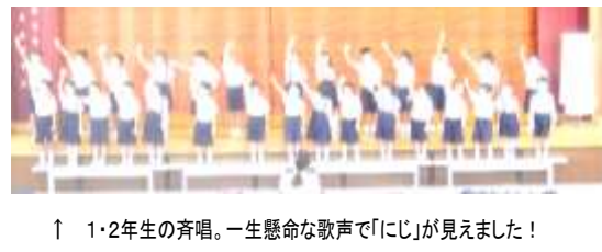
↑ 1・2年生の斉唱。一生懸命な歌声で「にじ」が見えました！