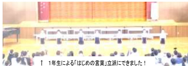
↑ 1年生による「はじめの言葉」立派にできました！

学年の発表はもちろん、昨年度に引き続いての全校合唱では保護者の皆様、地域の皆様の温かいまなざしと大きな拍手の中、子供たちは一人一人が主役となり、最後まで心を込めて演奏することで、また一つ大きな宝物となる経験を積み重ねることができました。応援してくださった皆様、本当にありがとうございました。