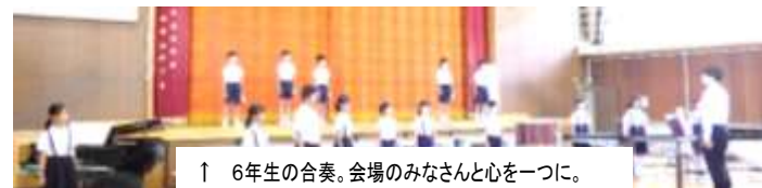
↑ 6年生の合奏。会場みなさんと心を一つに。