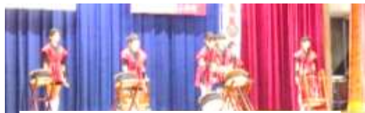
5年生 高見山太鼓の伝統を引き継いでいます