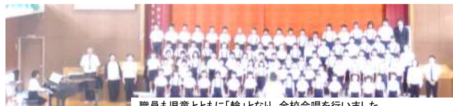
職員も児童とともに「輪」となり、全校合唱を行いました。

11月の予定表の訂正について 11月28日(金)の出張動物園は、1年生のみとなります。お詫びの上、訂正させていただきます。