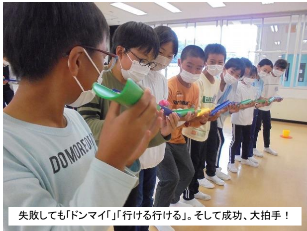
失敗しても「ドンマイ」「行ける行ける」。そして成功、大拍手！