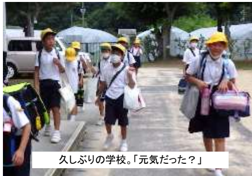
久しぶりの学校。「元気だった？」

長いと思っていた夏休みも、だんだん終わりが近づいてきました。いわゆる「猛暑日」が続いたり、新型コロナウイルスの感染がなかなか収まらなかったりと、心配な状況もありましたが、今日の登校日では、休み中の楽しかった体験を話してくれたり、お家でがんばった学習の成果を見せてくれたりと、子供たちの元気な姿を見ることができました。