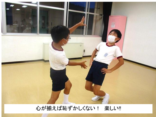
心が揃えば恥ずかしくない！ 楽しい！！

7月14日(木)、15日(金)の2日間、5年生は県立福山少年自然の家で「山・海・島」体験活動を行いました。5年生が掲げた目標は、①自然の中で過ごすよさを考えること ②相手意識をもつこと ③自己管理をしっかりすることの3つです。天候の関係で若干の変更もありましたが、5年生のみんなの明るく前向きな姿勢と礼儀正しさが光っていました。お世話になった県立福山少年自然の家の方が「とても明るくて爽やかな子供たちです。一緒に活動していると、私達も楽しく、うれしくなります。」と話してくださいました。(最高のほめ言葉を頂きましたね！)