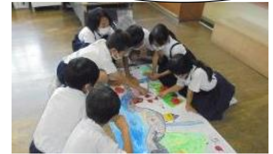
マップ検討中。「ここをもう少し…」

発表の前にはしっかり練習し、低学年にも理解できるように話す言葉や内容、話し方を考えたり、マップをわかりやすく改良したりするなど、相手意識をもった工夫がたくさん見られました。堂々と発表する4年生の姿は、「カッコいいお兄さん、お姉さん」そのもの。低学年の子供たちはとても頼もしく感じたことでしょう。お互いに学び合う素晴らしい「防災教育」の今後の取組が楽しみです。