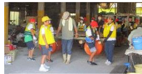
浜に向かっていかだを運び、いよいよ進水。