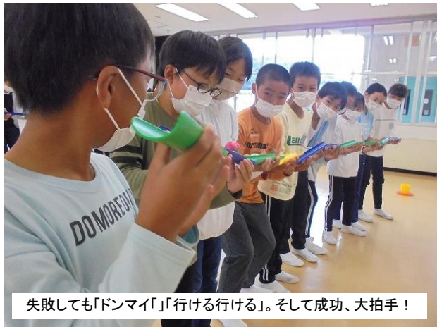
失敗しても「ドンマイ」「行ける行ける」。そして成功、大拍手！