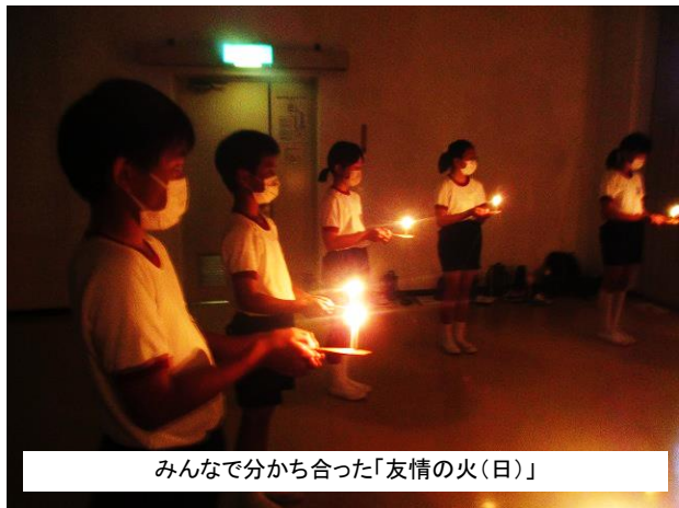
みんなで分かち合った「友情の火(日)」