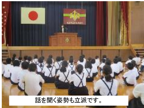
話を聞く姿勢も立派です。

7月20日(水)、令和4年度1学期の終業式を行いました。今年度もコロナ禍の中で、また天候不順もあって、学校行事も二転三転する毎日でしたが、そんな中でも目標を持って頑張る子供たちの姿をたくさん見ることができました。式では、1学期を振り返って、それぞれの学年の頑張りや気付きを学校長から全校に伝え、2学期に向けての目標を確認できる充電期間にもなる夏休みにしてもらいたいと話しました。