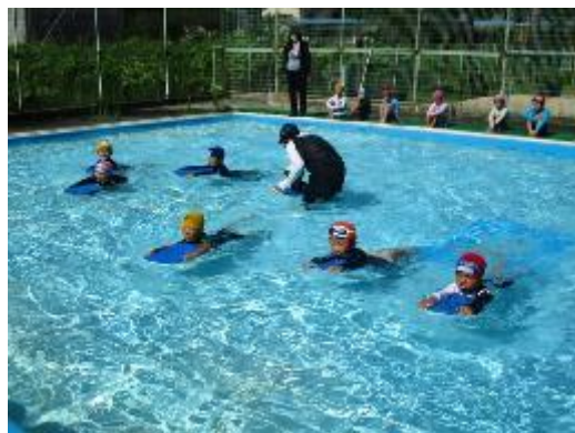
力を上手に抜いて…「ブクブク…パッ」(1・2年生)

今年度は3年ぶりの水泳学習を6月下旬から行うことができました。全て従来通りとはいきませんが、「密」を避ける工夫をしながら実施しました。