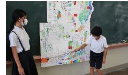
場所を示しながら説明します。