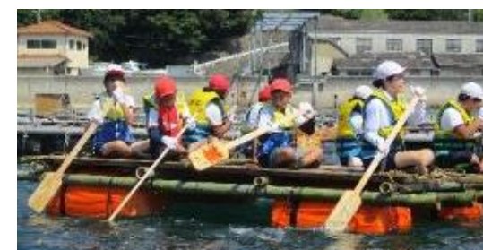
心を合わせて、前進! 前進!

7月1日(金)、6年生が、江府島探検に向けて自分たちで作ったいかだの試運転を行いました。倉庫の中に入っていた3艘のいかだを進水させ、漁協の浜から出発! それぞれいい味を出しながら沖へ出て行きました。はじめはオールのこぎ方もぎこちなく不安そうでしたが、徐々にコツをつかみながら、周辺を一回りしました。