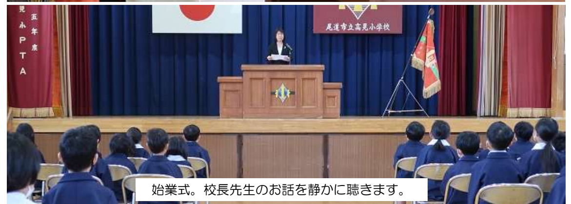
始業式。校長先生のお話を静かに聴きます。