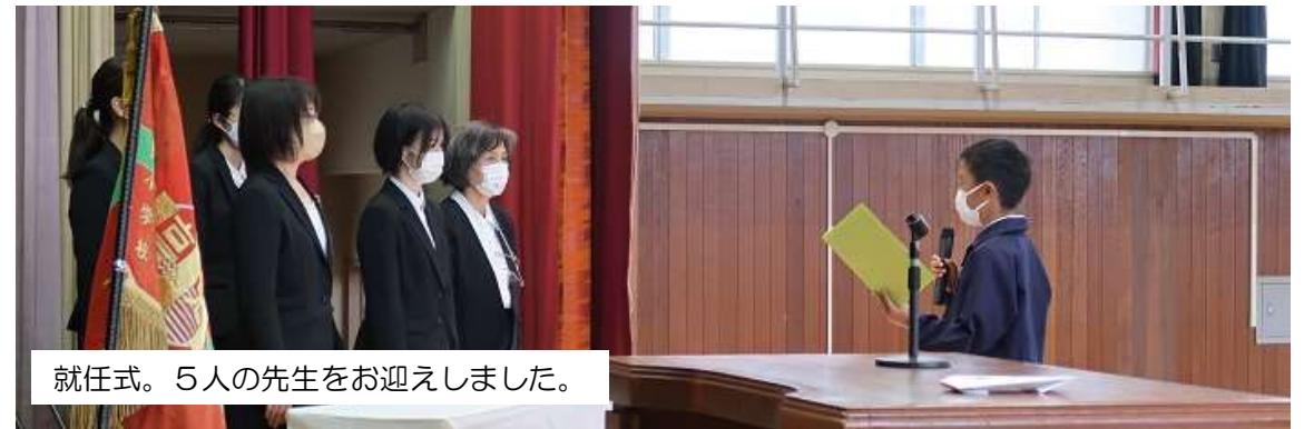
就任式。5人の先生をお迎えしました。