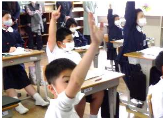
参観授業（5年生）。「意見があります！」

4月14日（金）、今年度最初の参観日を行いました。保護者の皆様には多数のご参観をいただき、ありがとうございました。子供たちは少し緊張しながらも、張り切って学習していました。