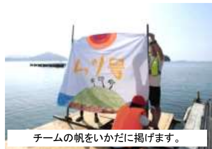
チームの帆をいかに掲げます。