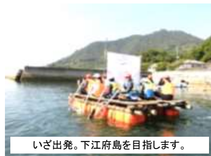
いざ出発。下江府島を目指します。

7月28日(金)、6年生が恒例の「江府島探検」にチャレンジ。全員で島へ上陸、往復航行を完遂することができました。荒天のために2回の延期を強いられた昨年とは打って変わった「好天」でしたが、悩ましかったのはそれゆえの暑さ。関係の皆様のご助言をもとに、熱中症対策を講じたうえで、島での滞在時間を減らすことにしました。苦しい選択でしたが、子供たちは持ち前の団結力で、互いに声を掛け合い、励まし合いながら無事探検を成功させました。島での活動など、子供たちの様子は次号で詳しくお伝えします。まずは、今年で22回目の航海を支えてくださった保護者の皆様、関係の皆様に深くお礼申し上げます。高見小伝統のこの学びをこれからも引き継ぎ、アップデートしていくために、今後ともご支援、ご助言をよろしくお願ひいたします。(次号に続く)