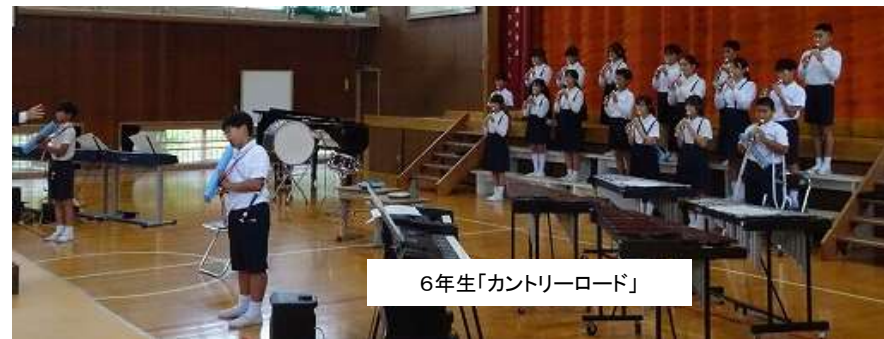
6年生「カントリーロード」