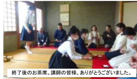
終了後のお茶席。講師の皆様、ありがとうございました。

「輝(きら)ら・鳴島」の2曲。「やはり感動しました」「大迫力で、子供たちの気持ちが伝わってきました」などなど、入魂の演奏にたくさんの賞賛のお声を頂きました。