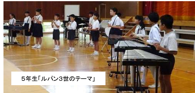
5年生「ルパン3世のテーマ」