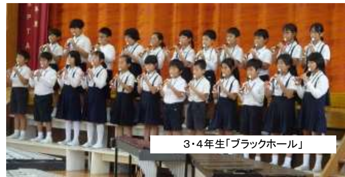
3・4年生「ブラックホール」

そして、練習の成果を出し切った合奏。惜しみない、大きな拍手を頂いた子供たちの表情は輝いていて、達成感・満足感にあふれているようでした。