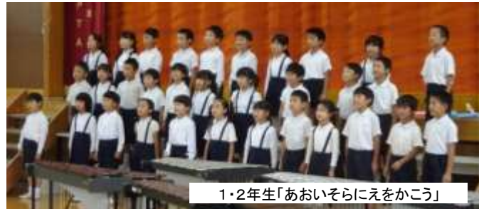
1・2年生「あおいそらにえをかこう」