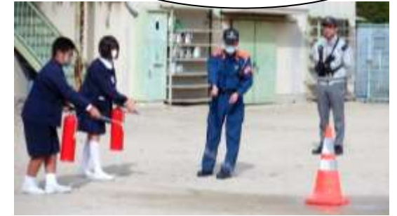
消火器体験。うまく扱えました！

11月13日(月)、火災避難訓練を行いました。尾道消防署向島分署から6名の署員さんにおいでいただき、実際に火災報知器を作動させ、初期消火、119番通報、避難誘導から残留者確認までの訓練行動を指導していただきました。子供たちには出火場所や時刻を事前に知らせることなく実施しましたが、静かに素早く避難し、集合する様子に署員さんも感心しておられました。