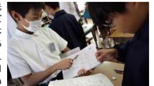
友達の考えを確認。「なるほど、確かに…」(6年生)