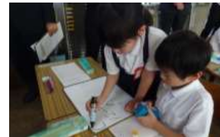
引き算の方法。「こう考えた方が…」(1年生)

11月7日(火)、向島中学校区の多くの先生方のご参加をいただいて「授業公開」を開催しました。研究授業として公開したのは1年生・6年生の算数科。1年生は、繰り下がりのある引き算を解く方法として「ひくたす法」「ひくひく法」の二つを考えました。6年生はいわゆる「順列・組み合わせ」で、4チーム総当たり戦の対戦カードを落ちや重なりなく調べる方法を考えました。