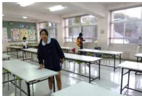
子供たちも一緒にがんばりました。