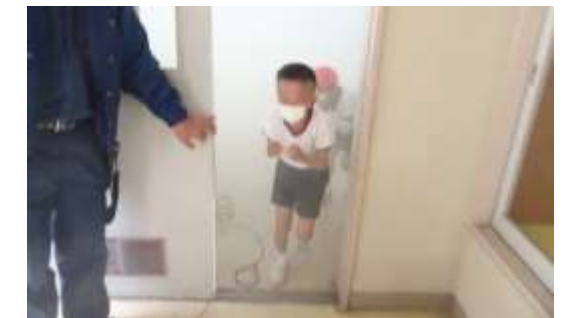
煙体験。「本当に何も見えないよ！」

集合後はグラウンドで消火器の使い方を教わり、代表の6年生が実際に消火器の操作を体験しました。その後は学年順に家庭科室で「煙体験」をしました。署員さんが準備してくださった煙が充満している家庭科室を壁沿いに一周。無害な煙ではありますが、全く視界がきかない中、どの子も姿勢を低くして慎重に行動していました。