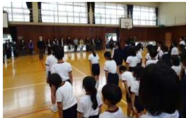
無事終了。「ありがとうございました。」