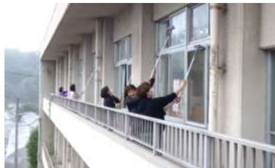
校舎を清掃。窓ガラスを外側から…

短い時間でしたが、子供たちの学びの場がとてもきれいになりました。子供たちの表情にもすっきりした気持ちが表れていたように思います。ご協力くださいました皆様、本当にありがとうございました。来年こそはまた干汐海岸の清掃ができるよう願っています。