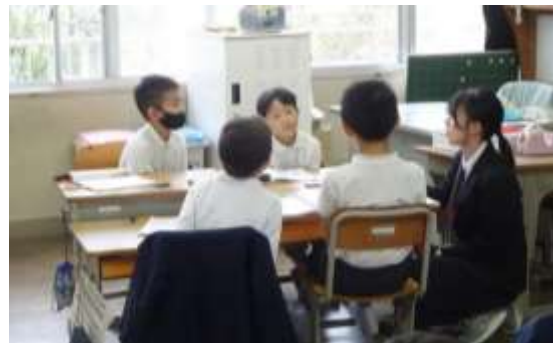
道徳の授業。「ぼくたちが話し合ったのは…」(2年生)

11月10日(金)、道徳参観日と清掃活動を行いました。計画していた伝統行事の干汐海岸清掃活動は雨天のため残念ながら断念。校内の清掃活動を実施しました。