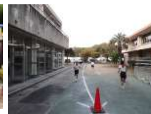
折り返し地点でも力いっぱい走り抜けました！