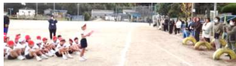
↑ はじめのあいさつ（低学年）

苦しい中走り抜いた、やり抜いた経験は、子供たちのこれからの学習や生活にきっとプラスになると思います。最後まで応援してくださった皆様、ご協力・ご声援、本当にありがとうございました。