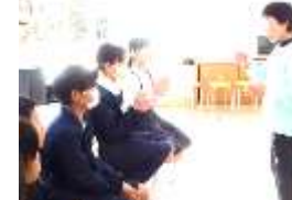
手話教室。「一つ一つの意味を考えながら」