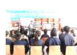
紙芝居。「平和の大切さ」