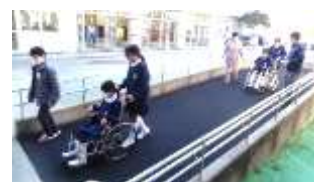
車椅子体験。「しっかりと声をかけながら」

また、12月12日（金）には、退職女性教職員の会の皆様から6年生が「向島捕虜収容所」の紙芝居を読み聞かせいただきながら、平和の大切さを学びました。