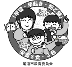
尾道市教育委員会