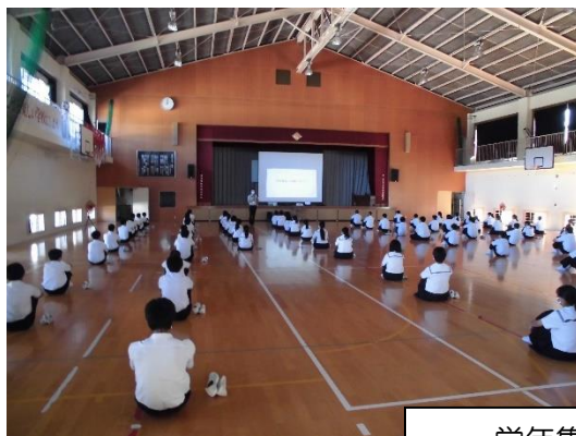
学年集会の様子です

上記の3つ。この中学2年の中だるみする時期だからこそ、全員で意識して生活していきたいと思えます。「これくらい、いいや」と思ってしまいがちなことにも、こだわってやっていけたらと思えます。「自分くらいいいや」という弱い自分に負けない集団をつくっていきましょう。