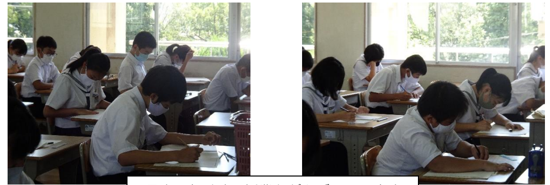
暑さに負けず、授業もがんばっています