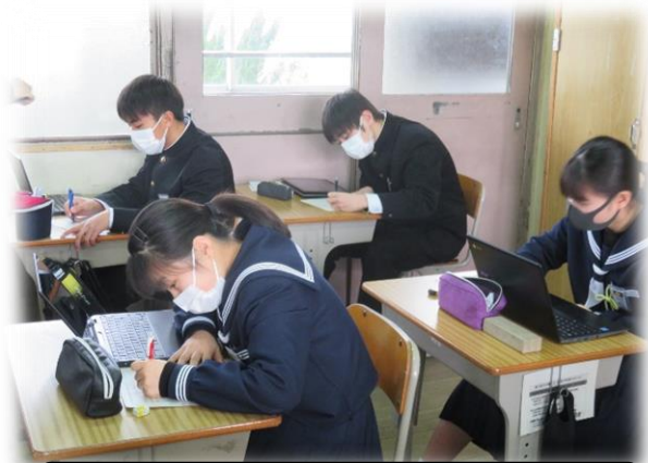
クロームブックを活用して調べ学習！

立志式を通して、自分自身と向き合い、自分自身がどう生きていきたいのかということや将来像を描きました。その立志式で抱いた「夢」や「志」を実現するためにこれから自分自身の進路を選択していかなくてはなりません。そのために、この2年時に多くの情報を得たり、探索したりして自分の進路や生き方を考えていってほしいと思います。15歳の春。自分自身にとってよりよい進路選択ができるよう取り組んでいきましょう。