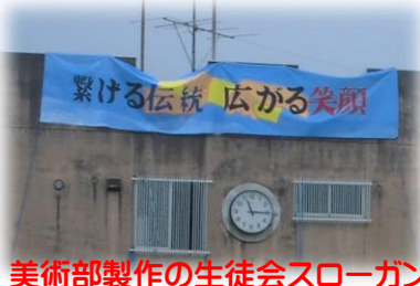
美術部製作の生徒会スローガン