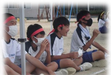
「団結」仲間への温かい声援