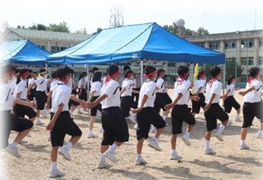
一生懸命頑張る姿(1年行進)