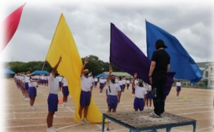
「宣誓」チームの誇りを胸に

保護者の皆様には、この度、様々なご心配やご不便をおかけしましたが、温かいご声援やご理解をいただき誠にありがとうございました。コロナ禍でなかなかご披露できていなかった、高西中生徒の躍動し輝く姿をご覧いただけたことと思います。以下に生徒の活躍の様子をお伝えします。