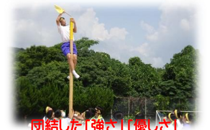
団結した「強さ」「優しさ」