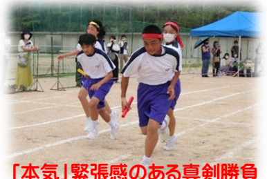
「本気」緊張感のある真剣勝負