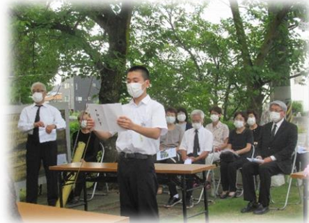
平和な社会の実現に向け、中学生としてできることを述べた平和宣言