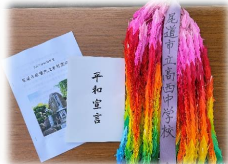
本校平和集会で全校生徒が平和への祈りを込め、折った千羽鶴