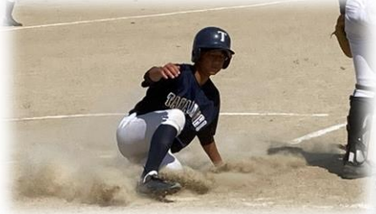
3年生にとって「最後の大会」どの部も粘り強いプレー、そして・・・「歓喜の瞬間」