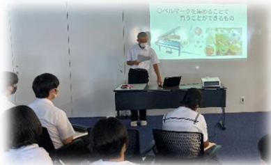
尾道市リーダー研修会で「コロナ禍でできる地域貢献」についてプレゼンする生徒会長

犠牲になられた方々を悼み、平和な世界の実現に向けた着実な歩みを誓う宣言をさせていただきました。