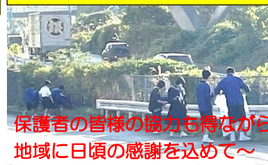
保護者の皆様の協力も得ながら地域に日頃の感謝を込めて～