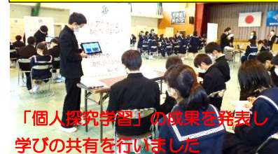
「個人探究学習」の成果を発表し、学びの共有を行いました