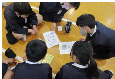
なぞとときに挑戦