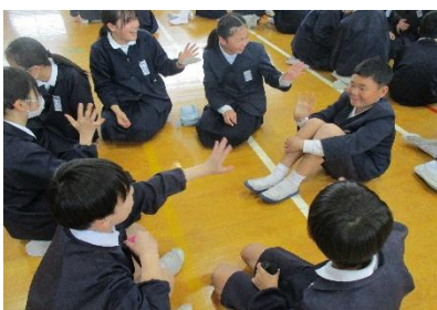
グルーピングゲーム