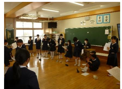
自己紹介ビンゴゲーム

3月10日(火)に高須小学校で、高須小学校と西藤小学校の6年生児童が交流会を行いました。仲間づくりを中心としたレクリエーションを体育館と教室に分かれて行いました。自己紹介やゲームを通して、自然と笑顔になったり声を掛け合ったりと楽しそうにしている姿をたくさん見ることができました。交流の後は、どちらの学校からも「たくさん声をかけてくれてうれしかった」「〇〇さんとまた会えるのが楽しみ」などの声を聞くことができ、中学校入学に向けてよい出会いの場になりました。