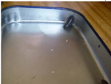
白い粒みたいなのが赤ちゃんです。