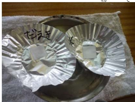
《左》だ液をつけたろ紙 《右》水をつけたろ紙