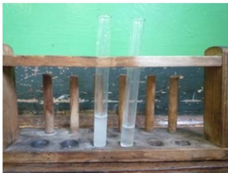
《左》吐いた後の石灰水 《右》何もしない石灰水

最初は透明だったのが、白く濁りました！ 自分が何気なくふつうに吸ったり吐いたりしている空気がこんな風になるなんて驚きました。 これからもっと調べていきたいです。