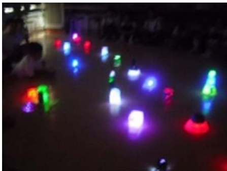
右がひこぼし。真ん中が天の川。左がおりひめです。

みんなで天の川は、こんな感じで・・・とか、光は水色がいいよねとか言っていて並べました。とっても楽しい時間だったあ〜。